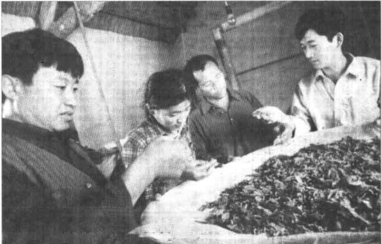
垦利县黄河口镇建林信用社因地制宜扶持农民大力发展植桑养蚕,先后投入扶持资金160万元,扶持养蚕专业户400余户,户均可增收5000元。

放心满意。 还病人知情权,让每一个患者明白看病的医疗费用和药品费用用到什么地方,明白确诊何病(尚不能确诊的,要向病人耐心解释),明白做什么检查……从而做到了让病人走进医院顺心,住进医院放心,离开医院舒心。该院还借鉴宾馆服务的有益做法,全面实行护士长首尾负责制,推行“七个一”服务。病人需要住院,护士长要安排专人迎接病人到病区,并协助办理住院手续,一直到治愈出院,护士长要全过程负责,提供周到细致的服务。凡住院病人,都可享受到“一个微笑、一声您好、一杯热水、一方手帕、一个健康牌、一束鲜花、一份住院须知和出院指导”的热情服务。 据医院近期收回的3000张有效问卷调查表统计,病人满意度由去年的93%升到了97%以上。五个月来收到感谢信、锦旗匾额30余件。评风、创百姓放心医院活动开展五个月来,没有发生一起医疗责任事故,没有发生一起大的纠纷。市内多家医院纷纷来参观学习,同时,他们的这些做法也得到了上级组织的认可。该院先后被授予全省“最佳医院”、“省卫生行业文明单位”、“被市政府授予‘平安单位’和‘文明示范大院’”、“庭院绿化先进单位”等多项荣誉称号。该院医务人员中有150人次受到省、市表彰,其中20人获市或卫生系统专业技术拔尖人才和东营市跨世纪优秀科技人才称号。 (本报记者 薄文军 通讯员 张乃龙)